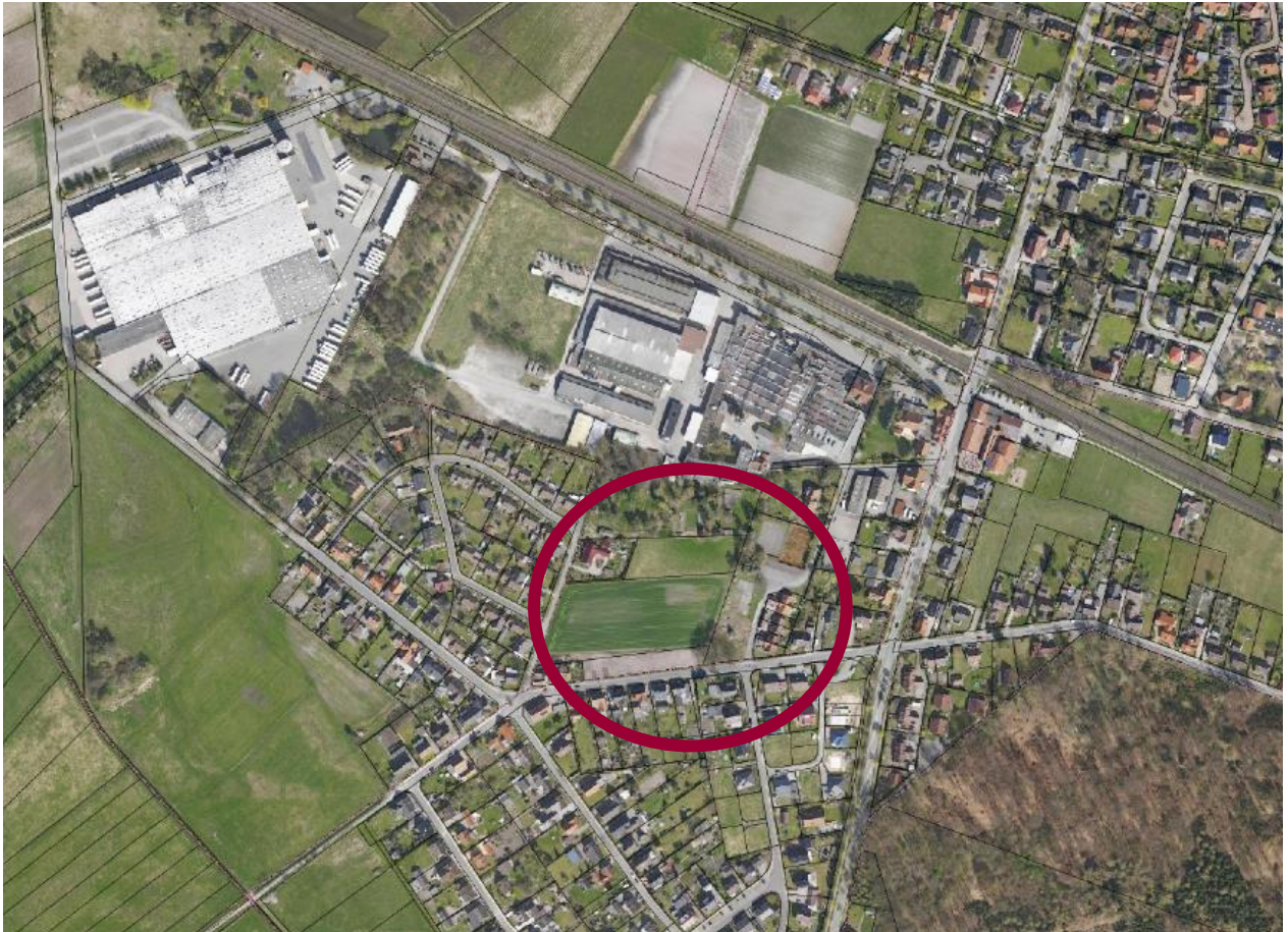
Luftbild des Geltungsbereiches

Der Geltungsbereich der Änderung des Bebauungsplanes „Vinckenaue“ befindet sich in der Stadt Melle im Stadtteil Oldendorf und liegt südlich der Else, nördlich der Straße Vinckenaue und westlich der Westerhausender Straße. Das Plangebiet umfasst die Flurstücke 111/5, 111/6/, 111/7, 111/8, 111/9, 111/10, 111/11, 111/12, 114/, 115, 116, 117/2, 117/3 und 121/7 (teilweise) der Flur 4, der Gemarkung Westerhausen und insgesamt eine Größe von ca. 29.928 m 2 . Der Geltungsbereich ist auch der Planzeichnung zu entnehmen.