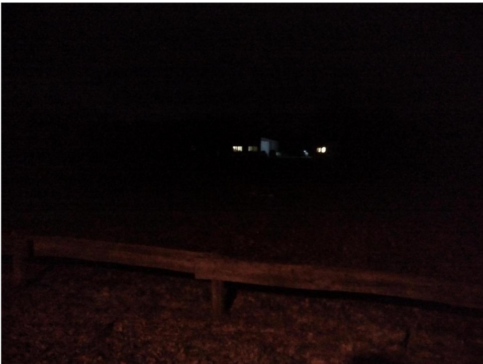
Photo um 6:30 Uhr, 06.02.2018 von der Straße am Festplatz hin zu den Unterküften