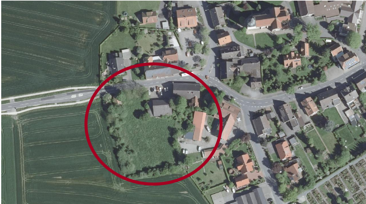
Luftbild des Geltungsbereiches

Der Geltungsbereich des Bebauungsplans liegt südlich der Straße „Alt Riemsloh“, westlich der „St.-Annener-Straße“ und bildet den westlichen Ortseingang zu Riemsloh. Er umfasst die Flurstücke 16/2, 16/4, 16/5, 16/6, 16/7, 16/8, Flur 1 der Gemarkung Döhren und ist in der Planzeichnung dargestellt.