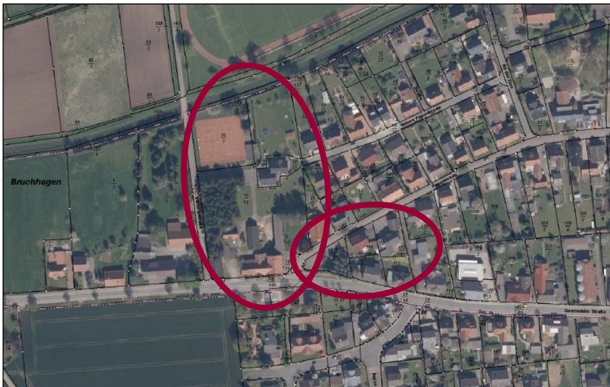
Luftbild des Geltungsbereiches

Der Geltungsbereich der Änderung des Bebauungsplans „Papenbreite“ befindet sich in der Stadt Melle im Stadtteil Gesmold und liegt südlich der Else, nördlich der Gesmolder Straße, östlich der Viktoriastraße und westlich der Papenbreite. Das Plangebiet umfasst die Flurstücke 8/1, 10/7, 10/12, 10/14, 10/15, 13/17, 18/10, 18/11, 18/14 (teilweise), 104/48, 104/49, 112/1, 114/1, 115/5, 187/6 und 187/7, der Flur 1, Gemarkung Gesmold und hat insgesamt eine Größe von ca. 16.224 m 2 . Die Abgrenzung des Geltungsbereiches ist aus der Planzeichnung zu entnehmen.